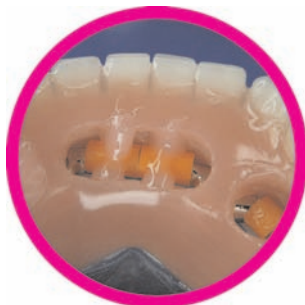
Prótesis sobre implantes