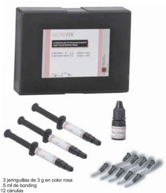
3 jeringuillas de 3 g en color rosa 5 ml de bonding 12 cánulas