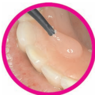
Cierre oclusal de tornillos con rosa o A3