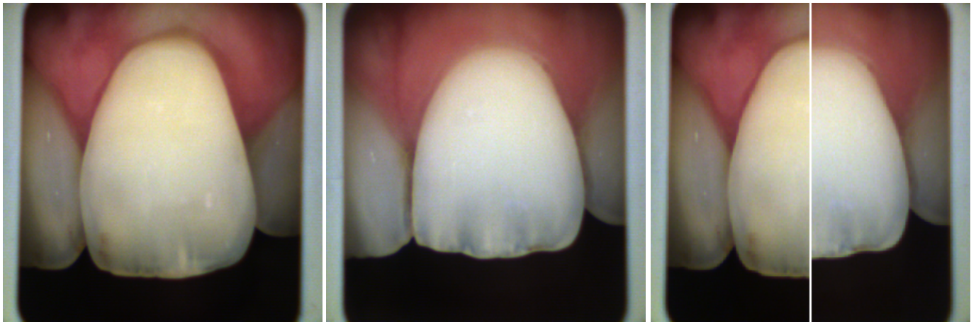
jueves, 25 de noviembre de 2021 / miércoles, 2 de febrero de 2022